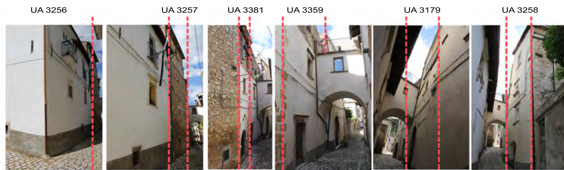
Via San Tussio